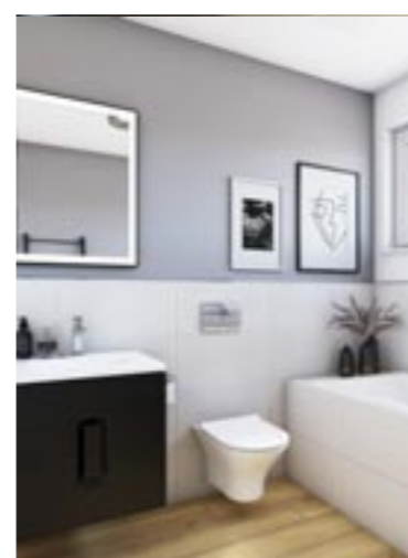
Das Badmodul kommt fix und fertig eingerichtet auf die Baustelle.

Das neue Next-Programm wird in Kürze um zwei- und dreistöckige Häuser erweitert