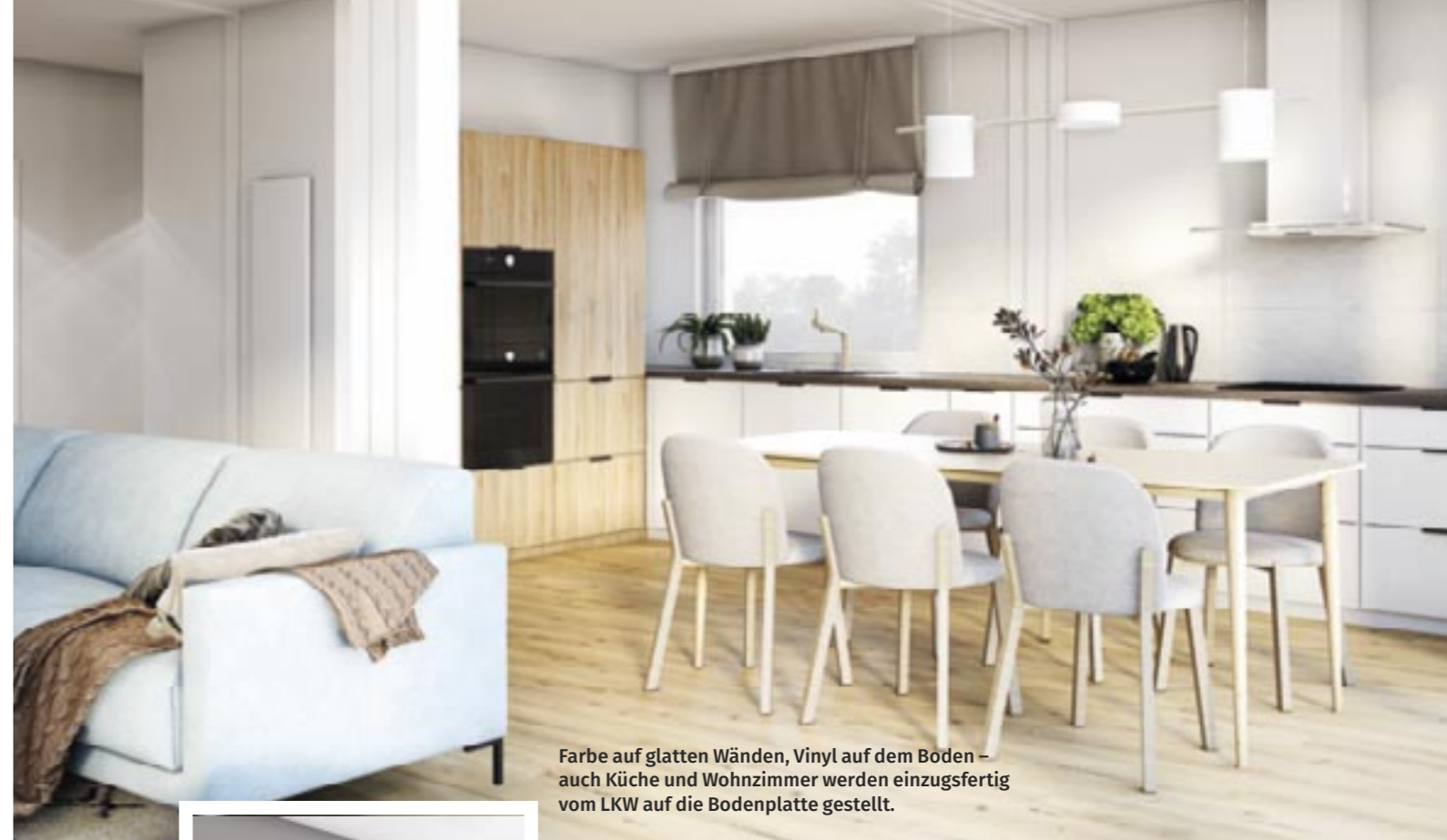
Farbe auf glatten Wänden, Vinyl auf dem Boden – auch Küche und Wohnzimmer werden einzugsfertig vom LKW auf die Bodenplatte gestellt.

Wer kein Flachdach wünscht, entscheidet sich für die alternative Walmdachvariante. Beide Dachformen sind übrigens mit oder ohne integrierte Terrassenüberdachung erhältlich. ●●●